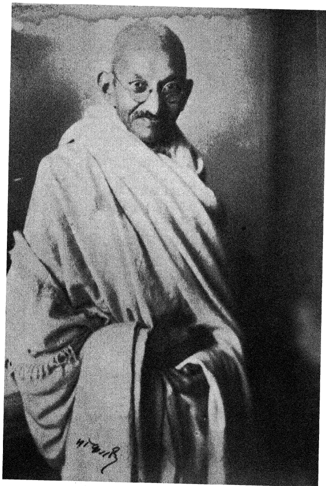
गोलमेज कांफ्रेंस के अवसर पर